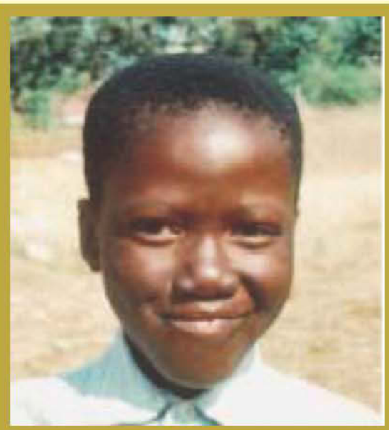
Baada ya Matibabu