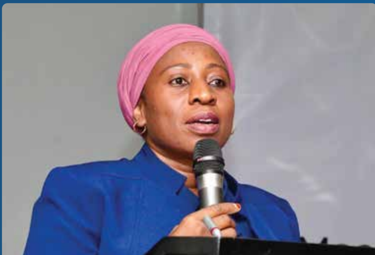
Mhe. Ummu Mwalimu WAZIRI WA AFYA

Dkt Wandwalo aliongeza kwa kusema Mfuko wa Dunia utaendelea kusaidia jitihada za kutokomeza ugonjwa wa TB nchini Tanzania na duniani kwa ujumla mpaka pale ugonjwa huu utakapotokomezwa kabisa pindi ifikapo mwaka 2030 pamoja na kutenga kiasi ya dola bilioni 2.4 kwa ajili ya kusaidia nchi zote kwa kipindi cha miaka 3 ijayo zenye tatizo la ugonjwa wa Kifua Kikuu duniani na Tanzania ikiwemo.